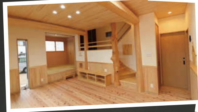
木の香りに包まれた約16帖のLDK