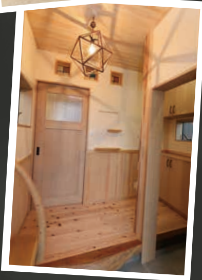
土間4又2区画内を繋ぎ、ベンチやニッチのある玄関ホール