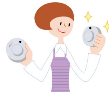
古くなったら交換