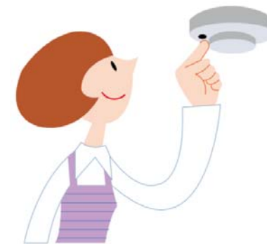
定期的な作動確認

作動確認をしても警報器に反応がなければ、本体の故障か電池切れです。(※2)警報器の本体又は電池を交換しましょう。