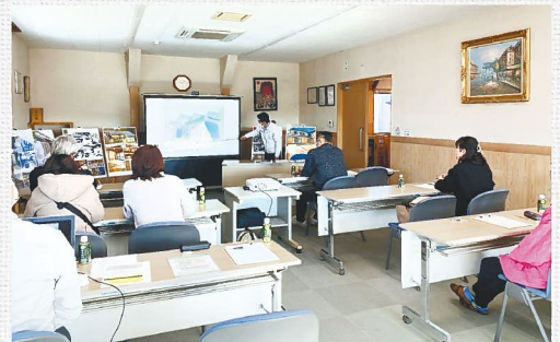
前回の様子(会場:森本工務店)